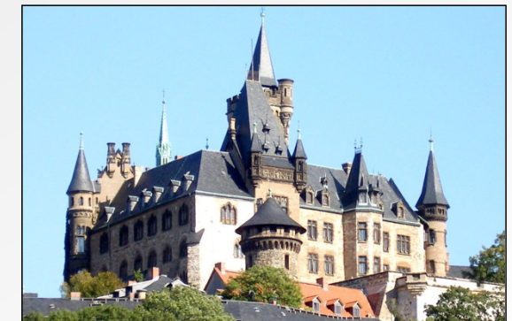
Schloss von Wernigerode (ca. 15 min entfernt)

Tel.: 03943 - 55 77 170 Mobil: 0160 - 33 88 162 info@haus-zur-stadtecke.de www.haus-zur-stadtecke.de