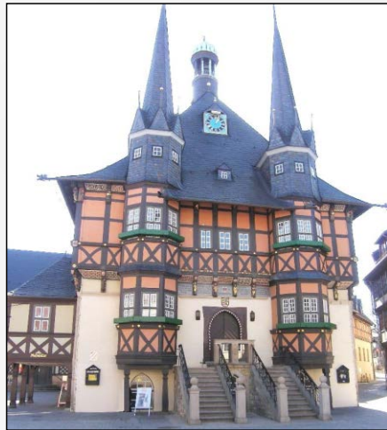
500-jähriges Rathaus (ca. 15 min entfernt)