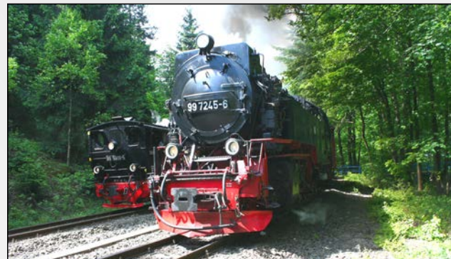
Brockenbahn (Bahnhof ca. 5 min entfernt)

Eine Anreise ist auch mit der Bahn möglich ☺